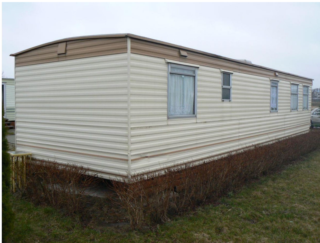
Domek nr 1